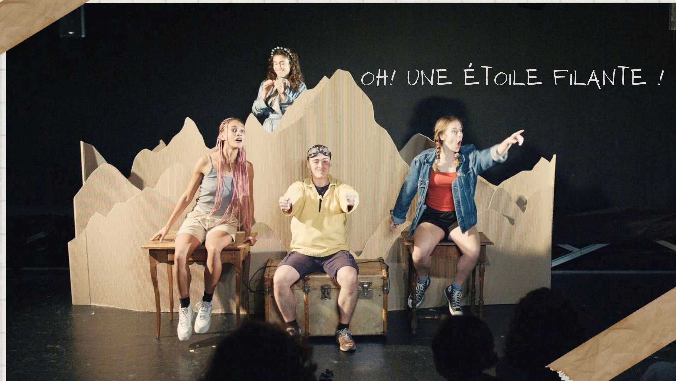
Théâtre de l'Atalante, maquette présentée dans le cadre du festival "Court mais pas vite" en octobre 2023.