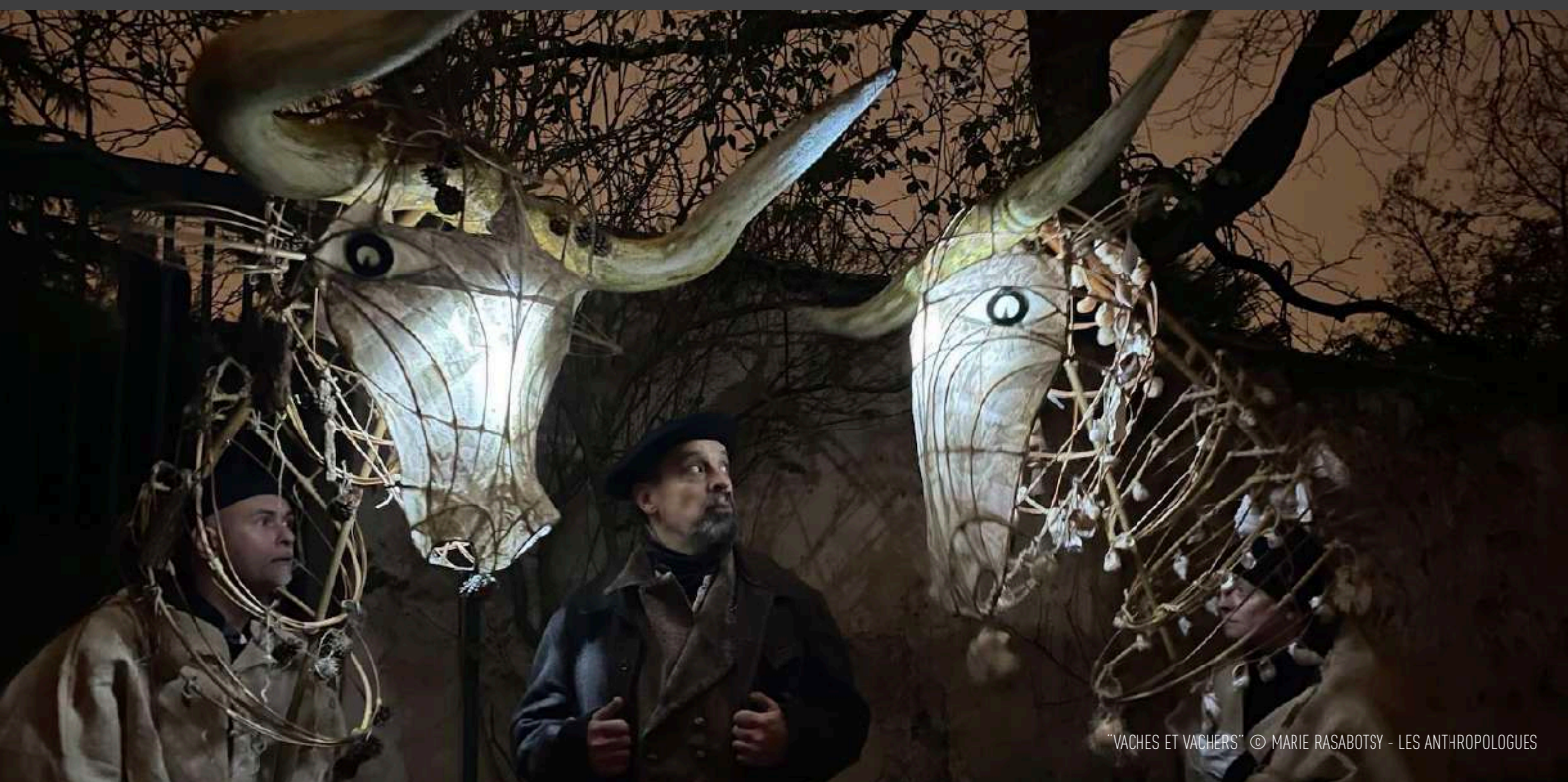
"VACHES ET VACHERS" © MARIE RASABOTSY - LES ANTHROPOLOGUES